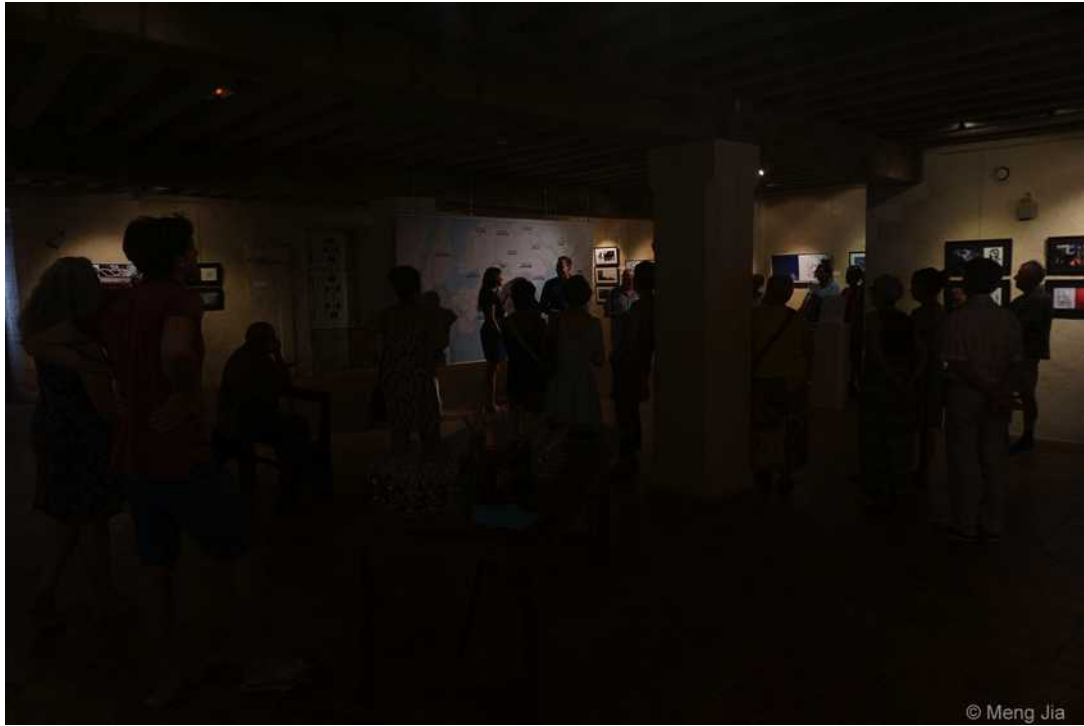
Ouverture de l'exposition (août 2018)