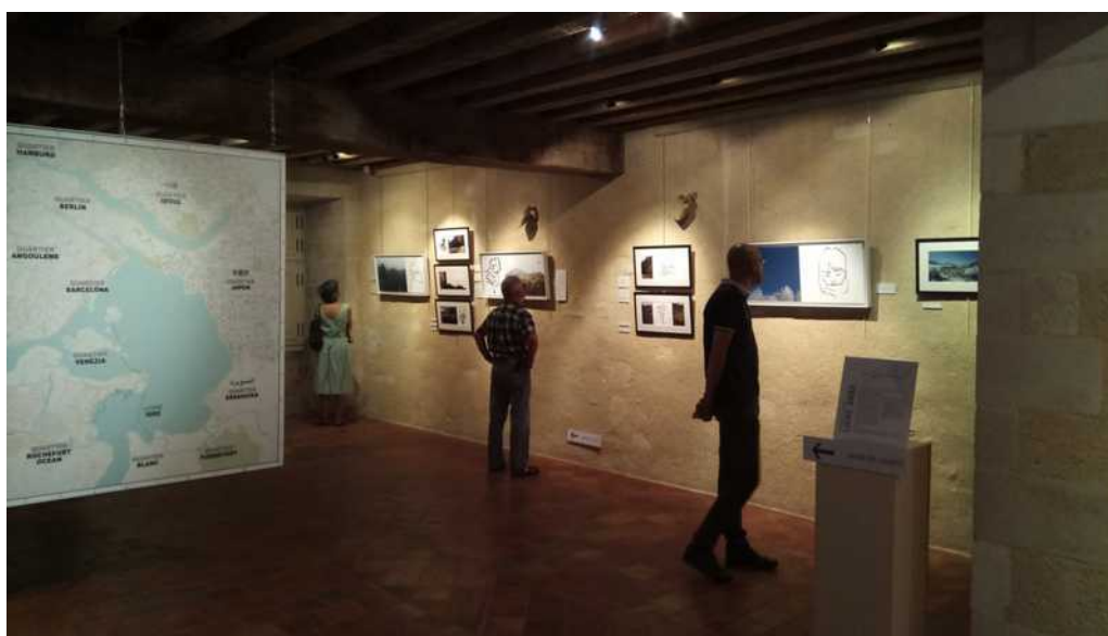
Paysages Urbains 14>18 – LA VILLE BLEUE 08>18