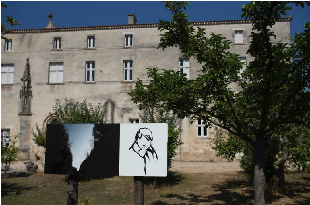
Quartier Blanc – LA VILLE BLEUE 08>18