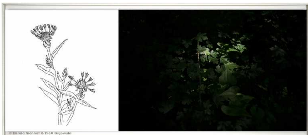
Quartier La Lande