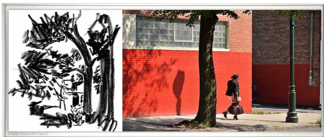
Quartier New Rochelle