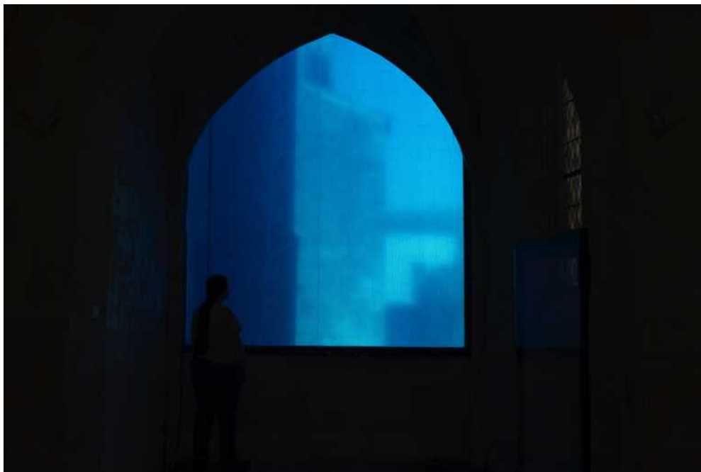
« BLEUE I » - vitrail

Voici quelques photos de l'exposition LA VILLE BLEUE 08>18 à La Commanderie des Antonins :